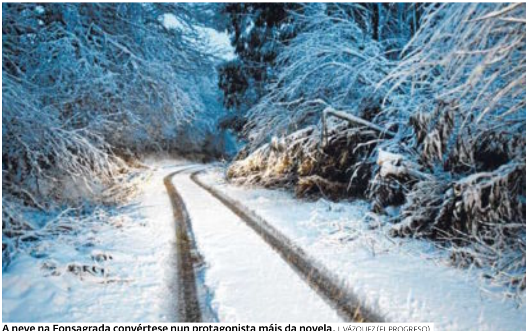
A neve na Fonsagrada convértese nun protagonista máis da novela.