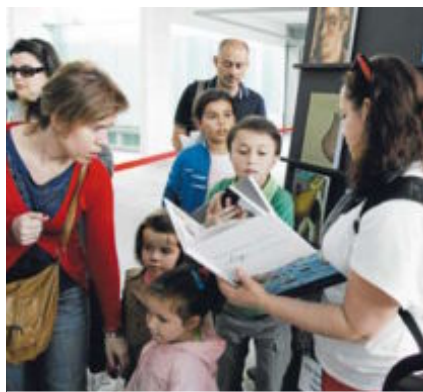
Visitantes do Museo agasallados onte con libros da Deputación. ÁNGEL BARREIRO